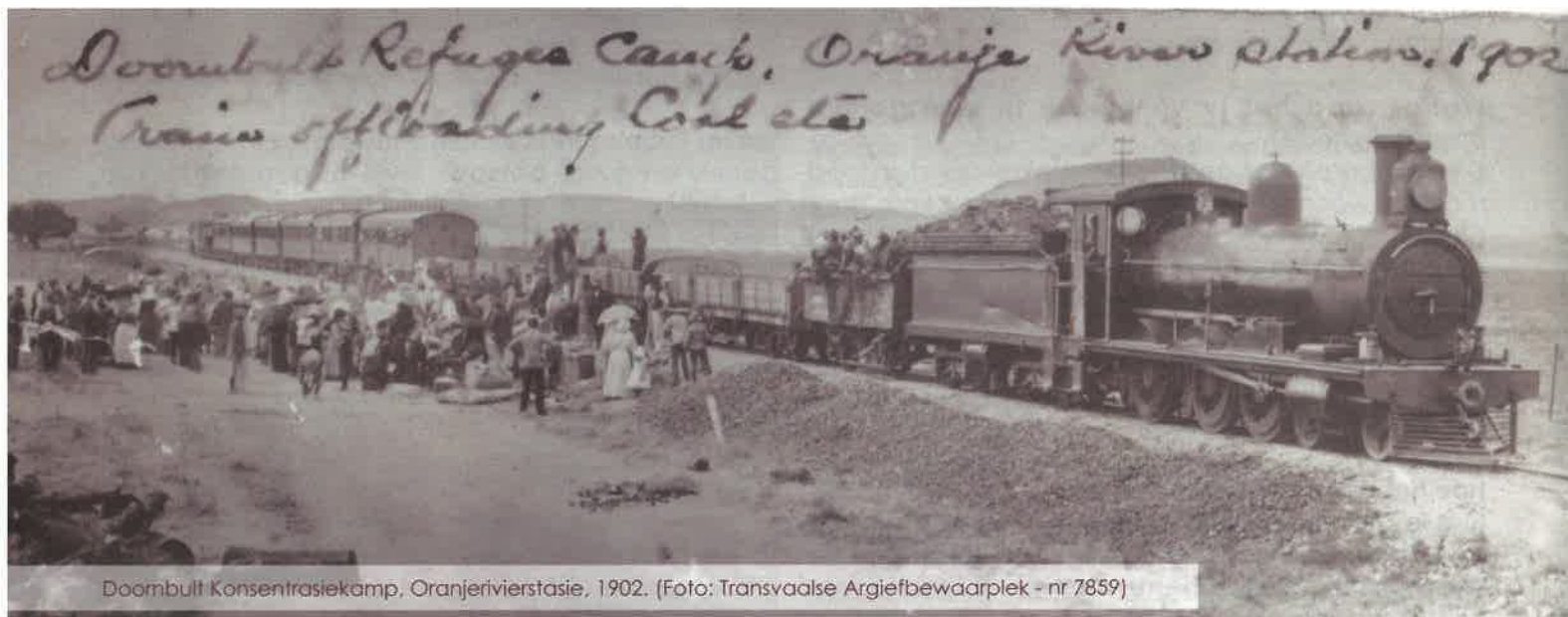
Doornbult Konsentrasiekamp, Oranjerivierstasie, 1902.